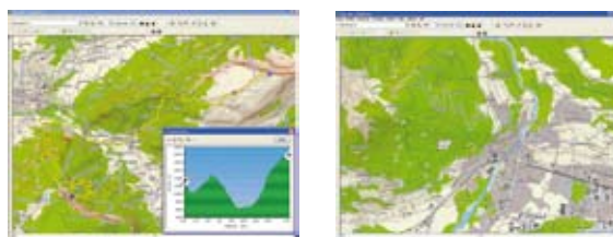
Exemple de visualisation des données sur un écran PC.